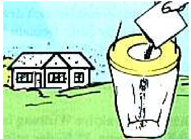
Napełnianie pułapki przynętą