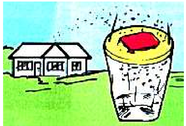
Pułapka REDTOP wylapuje muchy na zewnątrz budynku