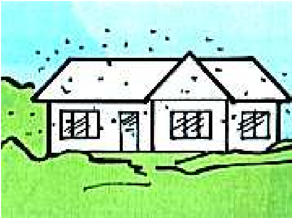
Letnia zmora: muchy!