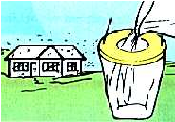
Do worka wlewamy 1 l wody